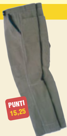
7. Pantalone CANVAS