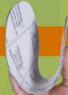
19. ART. 3100 NABUK S3 Muratore alta. Lavori interni.