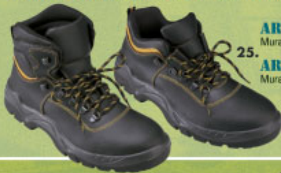
ART. 3100 S3 Muratore alta.