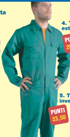
4. Tuta estiva