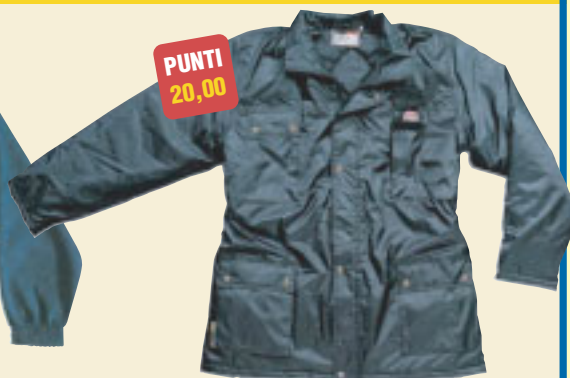
9. Giaccone MISTER Nylon trapuntato